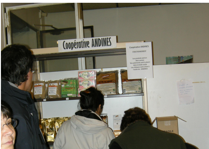
Mini espace de ventes dans le local de la Cité Langevin.

La Coopérative Andines est membre de l'association MINGA.