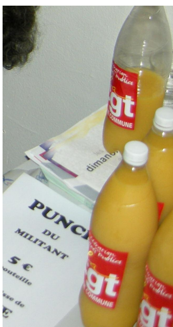
Un punch de soutien est apparu durant le mouvement d'octobre. Il fut apprécié.

Afin d'aller dans de bonnes conditions vers une production bio, utilisation